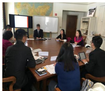
在美国雪城大学进行合作交流