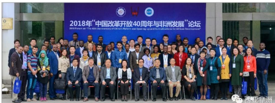
主办单位：电子科技大学西非研究中心 中国社会科学院西亚非洲研究所《西亚非洲》编辑部 2018.4.14 中国·四川成都