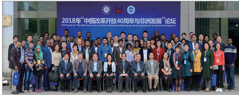
主办单位：电子科技大学西非研究中心 中国社会科学院西亚非洲研究所《西亚非洲》编辑部 2018.4.14 中国·四川成都

时间：2018 年 4 月 14 日 地点：电子科技大学清水河校区 Time: April 14, 2018 Location: UESTC , Qingshuihe Campus